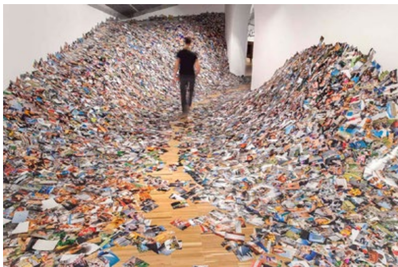
Ilustración 2: Eric Kessel. 24 horas en fotos. (Instalación)

Si la producción de imágenes participa de la destrucción de los seres humanos, es una tarea de todo sujeto, pero también de la educación, de aquellos que nos dedicamos a trabajar en ámbitos educativos, el preguntarnos cómo desarticular esa producción de imágenes, cómo poner en crisis las estructuras de poder que nos dominan.